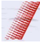
මෙම ලකුණ රතු සහ සුදු වර්ණවලට සීමා වේ.