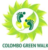
COLOMBO GREEN WALK

(1) சின்னம் இல.: 177954; (2) பெற்ற திகதி: 2013 ஆம் ஆண்டு பெப்புருவரி மாதம் 08 ஆந் திகதி; (3) முந்துரிமை கோரப்பட்டால்: - ; (4) விண்ணப்பதாரியின் பெயரும் முகவரியும் (சின்னத்தின் சொந்தக்காரர்): லங்கா இலவன்ட் மெனேஜ்மன்ட் (பிறைவெட்) லிமிட்டெட், இல. 38, புகையிரத நிலைய வீதி, வத்தளை, இலங்கை; (5) இலங்கையில் அவருக்கேதும் விலாசமிருப்பின், அது: லங்கா இலவன்ட் மெனேஜ்மன்ட் (பிறைவெட்) லிமிட்டெட், இல. 38, புகையிரத நிலைய வீதி, வத்தளை; (6) வகுப்பு: 45; (7) பொருட்கள் அல்லது சேவைகள்: சமூக சேவைகள்; (8) சின்னத்தின் பிரதி உருவம்: